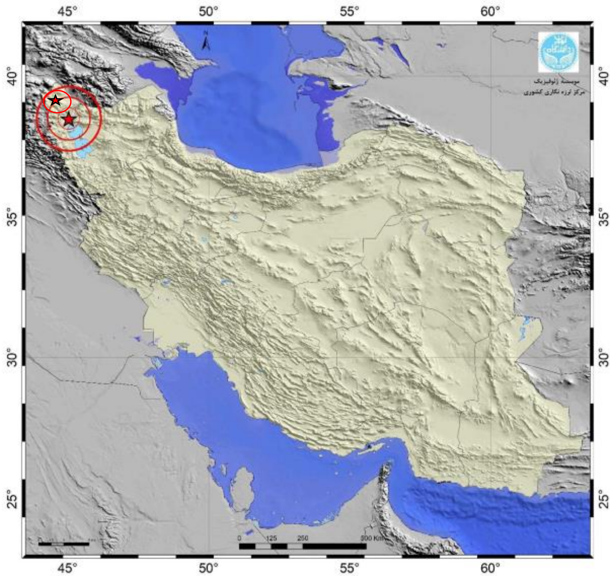
شکل 2). رو مرکز زمین لرزه های شهرستان خوی (آذربایجان غربی) گزارش شده توسط مرکز لرزه نگاری کشوری